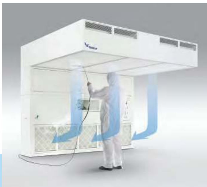
Principio de funcionamiento de las cabinas para pesada y muestreo.