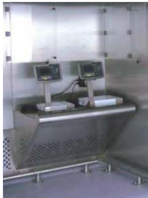
Mesa perforada instalada en el fondo de la cabina