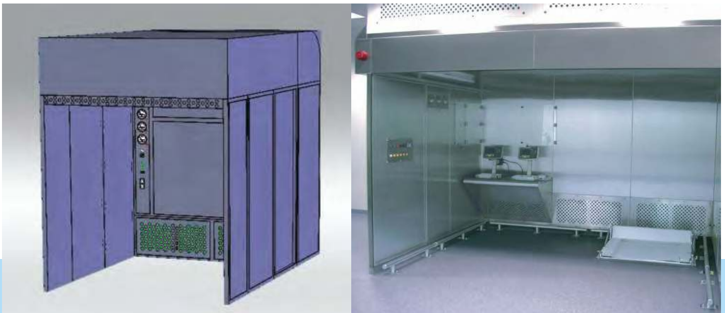
Cabina para pesada y muestreo modular de acero inoxidable AISI 304L con recirculación

Líderes en el diseño y fabricación de sistemas integrados