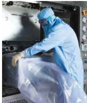
Cambio seguro de filtros Bag in/ Bag out