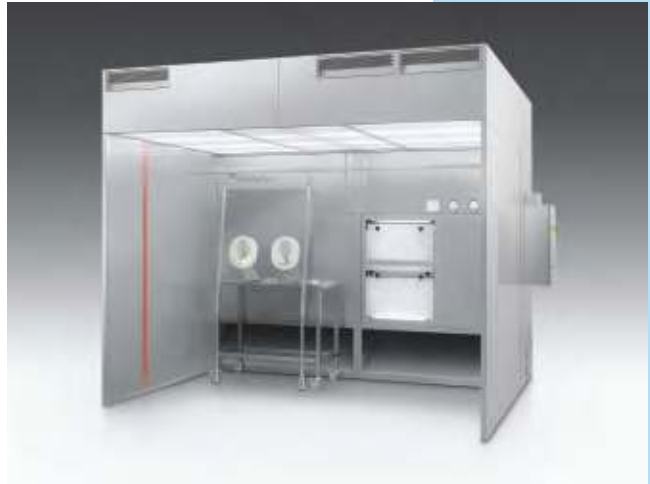
Cabina para pesadas y muestreo compacta con recirculación de acero inoxidable AISI 304L