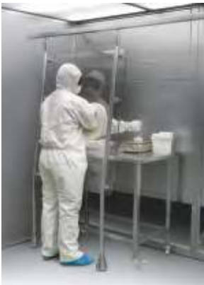
Pantalla de contención rígida con guantes