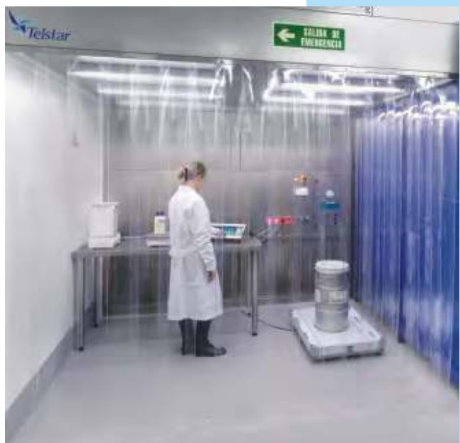
Cabina para pesadas y muestreo compacta de acero inoxidable AISI-304L con recirculación instalada en el interior de un almacén