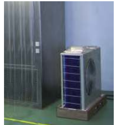
Sistema de refrigeración split con unidad condensadora externa